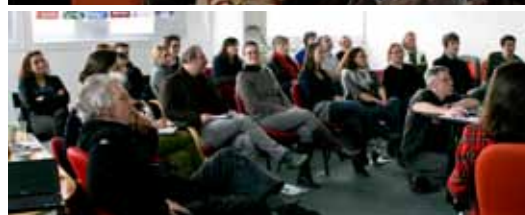
L'équipe de Territoires Sites & Cités en réunion, 2011