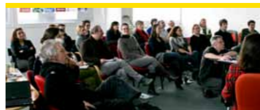
L'équipe de Territoires Sites & Cités en réunion, 2011

Urbanistes OPQU Architectes DPLG Paysagistes DPLG Juristes en droit public Économistes Sociologues Géographes Archéologues Historiens de l'Art Environnementalistes Graphistes Cartographes